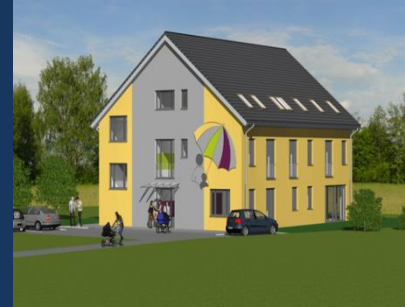
Mutter/Vater Kind- haus Schwarzenbek