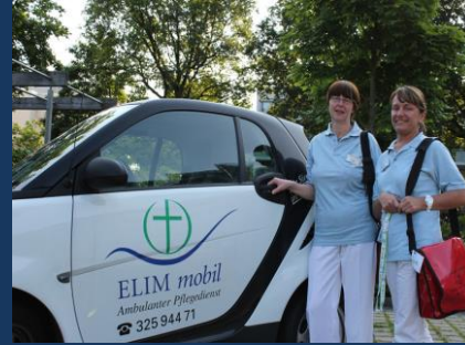
2 ambulante Pflegedienste