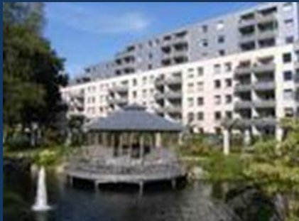
6 Servicebüros Wohnanlagen