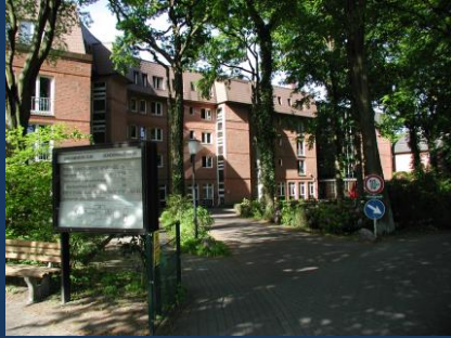
3 stationäre Seniorenzentren