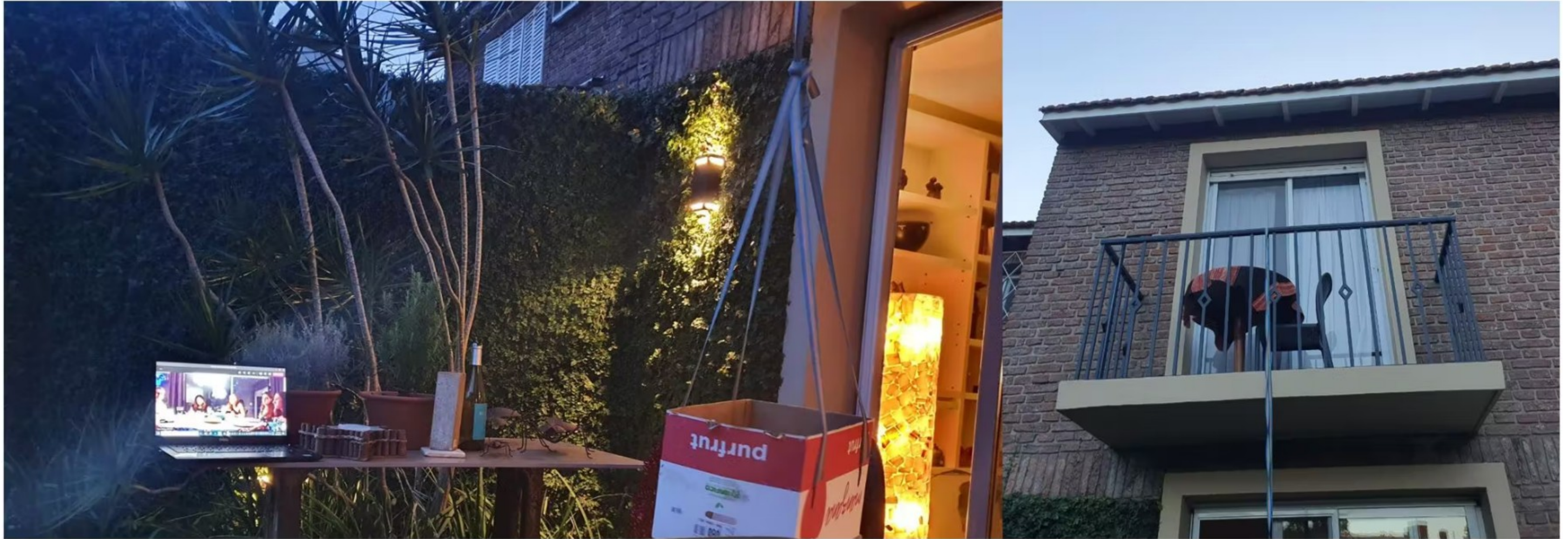
Mein Weihnachten 2020